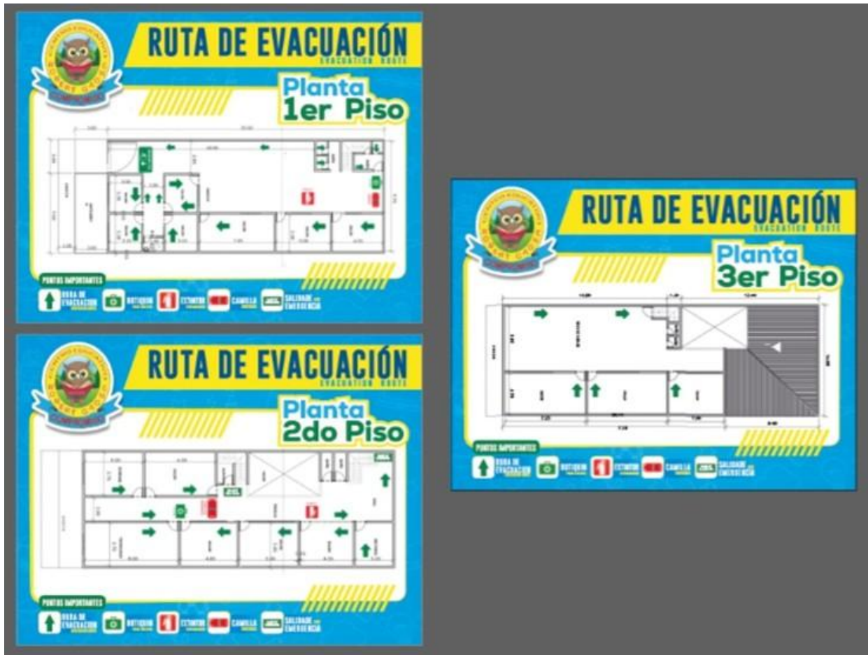
Figura 4. Plano de la Planta Física