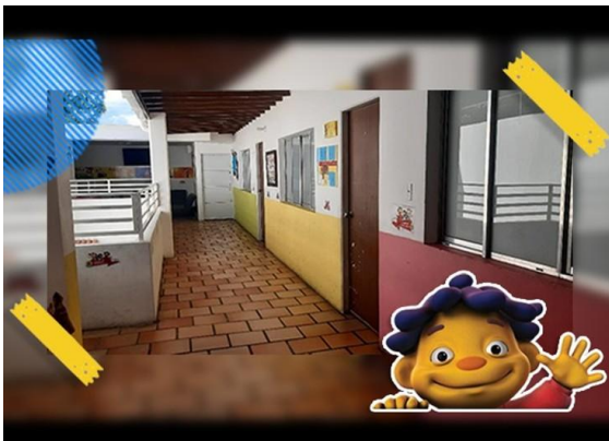
Figura 5. Fotos de la Institución Educativa