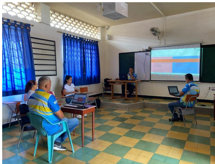
Figura 1. Evidencias de asistentes a la evaluación del PMI