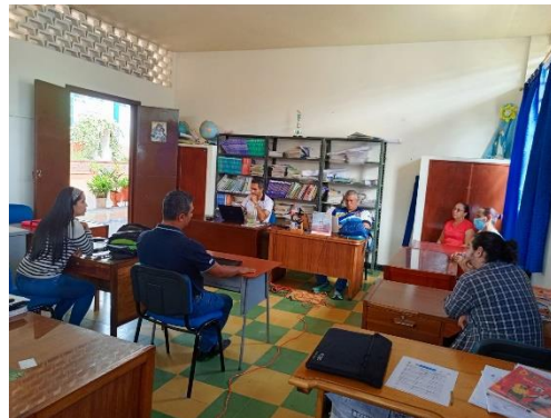
Figura 1. Evidencias. Análisis y ajuste del PMI