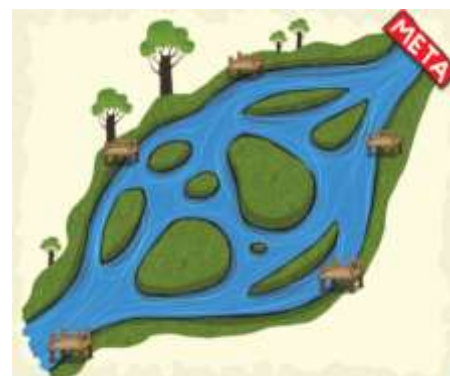
Ilustración 1. Trayectoria de la Indagación. Xua, Teo y sus amigos (ONDAS)

A continuación se enmarcan paso a paso las trayectorias a seguir en el proceso de investigación, estas pueden varias dependiendo de la línea temática del proyecto.