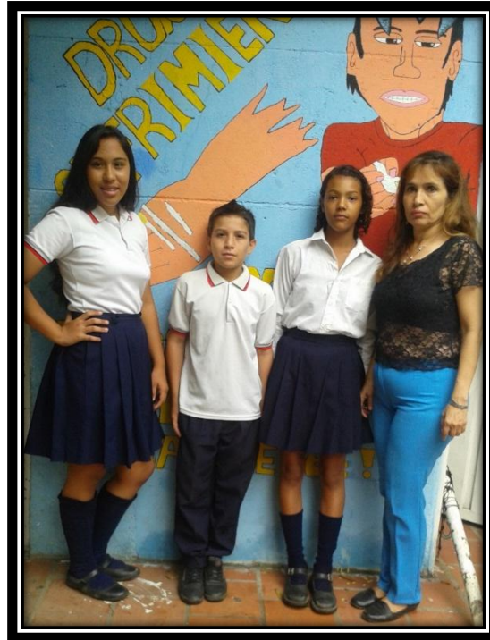
Exposición del mural la drogadicción