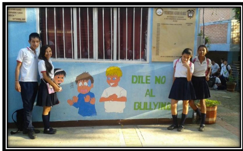
Exposición mural el bullying